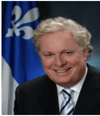
M. Jean Charest-PLQ

LE CONSORTIUM DES TÉLÉDIFFUSEURS RÉUNISSANT RADIO-CANADA, TVA ET TÉLÉ-QUÉBEC EN EST ARRIVÉ À UNE ENTENTE AVEC LE PARTI LIBÉRAL DU QUÉBEC, L'ACTION DÉMOCRATIQUE DU QUÉBEC ET LE PARTI QUÉBÉCOIS SUR UNE FORMULE PERMETTANT LA TENUE D'UN DÉBAT DES CHEFS OPPOSANT JEAN CHAREST, MARIO DUMONT ET PAULINE MAROIS. LE PARTI VERT (PV) ET QUÉBEC SOLIDAIRE (QS) SONT TOUTEFOIS ÉCARTÉS DE L'EXERCICE.