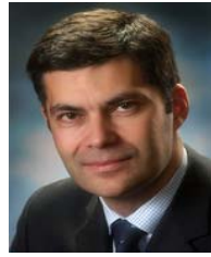
M. Mario Dumont-ADQ