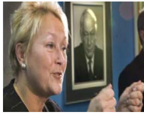
Mme Pauline Marois-PQ

Tel que le souhaitent les membres du Consortium, il s'agit d'une formule de débat renouvelée qui comporte toutefois certains échanges plus encadrés entre les chefs. Déterminés d'un commun accord par les membres du Consortium des télédiffuseurs, la date et le choix de Stéphan Bureau comme animateur du débat ont été communiqués aux représentants des trois principaux partis en lice dans la campagne électorale québécoise qui les ont entérinés.