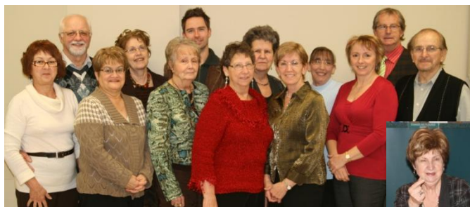
Merci aux correspondants d'Albanel. (version intégrale de septembre à mars)

Pour terminer, l'AQDR section St-Félicien tient à remercier tous les aînés qui ont participé bénévolement à ces projets de correspondances :