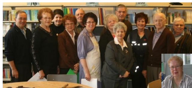
Merci aux correspondants de Saint-Prime. (version abrégée de janvier à mars)