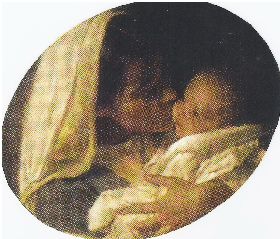
Cette image est la contribution de Claire Lavarière